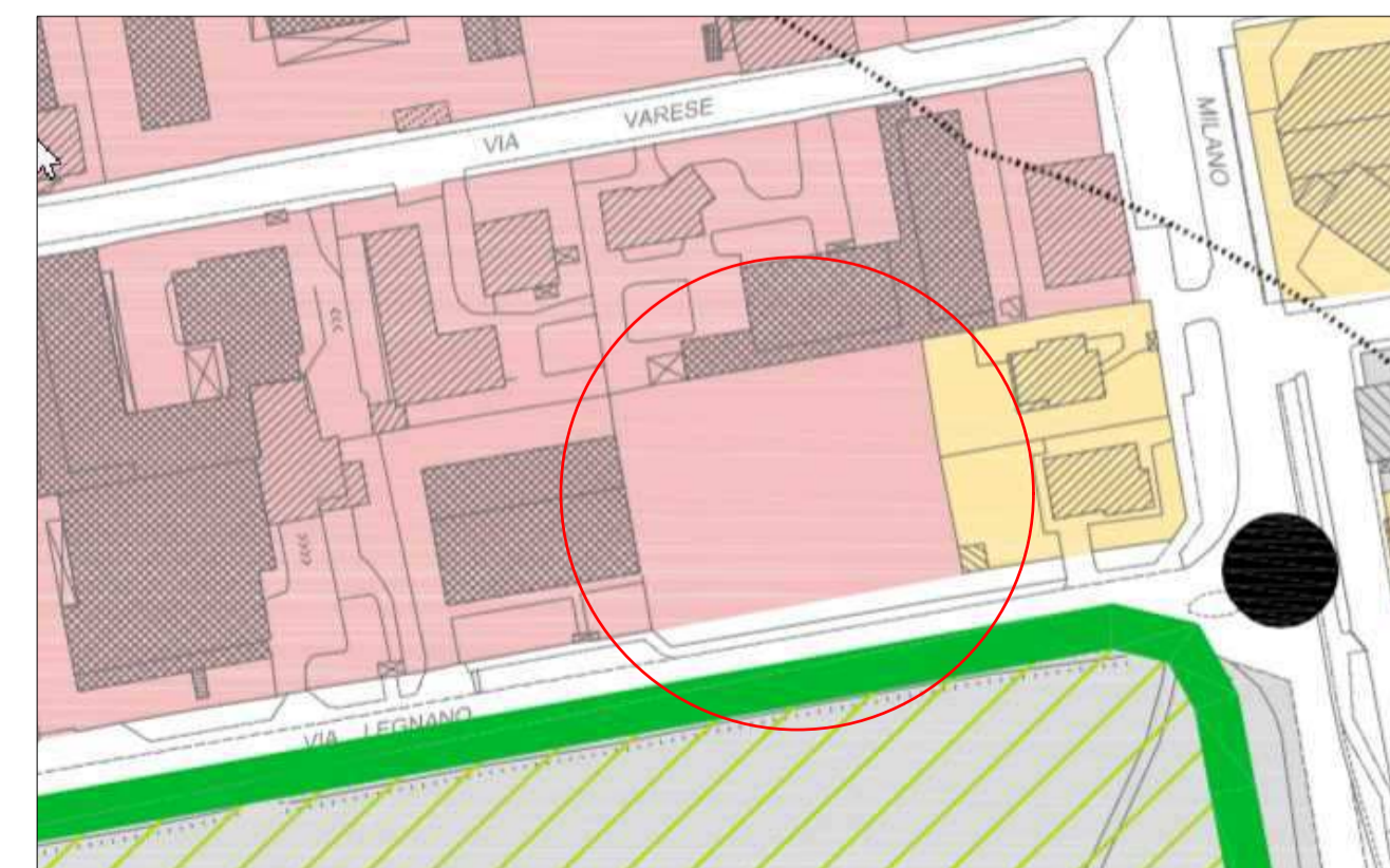
COMUNE DI MUGGIO' ESTRATTO PGT ZONA D2