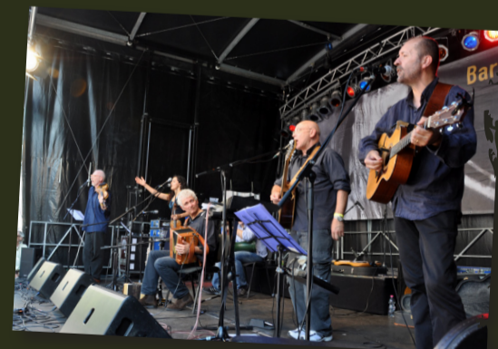
Barabàn al Bardentreffen Festival, Norimberga (Germania)